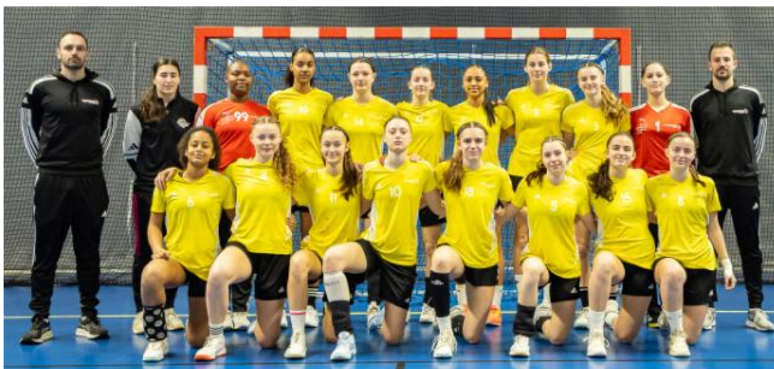
L'équipe de Ligue Bourgogne Franche Comté 5 ème des Interligues