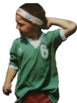
Nikola Karabatic, Au tournoi de Bethoncourt (Photo hand action)